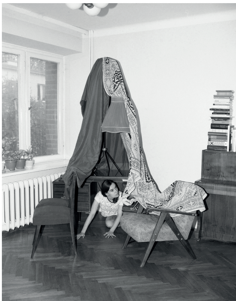
FSP ING 0171 bez tytułu, 2017, odbitka żelatynowo-srebrna, 120 x 95 cm ed. 3/3+1 AP

Urodziła się w 1985 roku w Warszawie, mieszka i pracuje w Londynie. Studiowała fotografię na krakowskiej Akademii Sztuk Pięknych oraz w Royal Collage of Art w Londynie. W centrum jej zainteresowań mieści się obserwacja ekspresji relacji międzyludzkich w ramach szerszych systemów – polityki, ekonomii, życia rodzinnego i społecznego. Często fotografuje swoje najbliższe otoczenie, rodzinę i przyjaciół, oraz wnętrza mieszkalne. Aranżuje w nich pół-improvizowane sceny, które dokumentuje analogowym aparatem fotograficznym. Przestrzeń domowa nabiera charakteru teatralnej sceny, miejsca codziennego spektaklu. Czarno-białe zdjęcia nadają codziennym gestom dramatycznego charakteru, odsłaniając niewidzialne mechanizmy władzy i emocjonalnej zależności. W 2014 roku MACK Books opublikowało jej monograficzną książkę Frowst . W 2017 roku jej druga książka, Frantic , ukazała się nakładem Humboldt Press. W 2018 roku brała udział m.in. w wystawie Being: New Photography w MOMA w Nowym Jorku oraz w tegorocznym 10 Berlin Biennale.