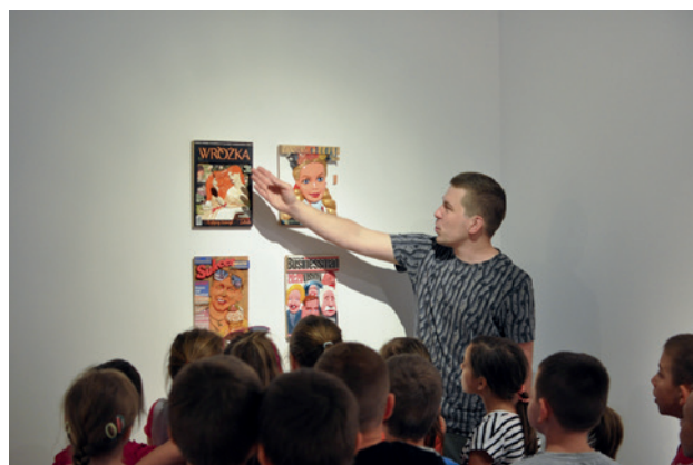
Galeria Sztuki Współczesnej w Opolu oprowadzanie dla dzieci