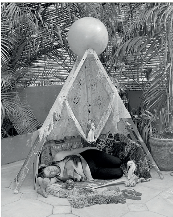
FSP ING 0170 bez tytułu , 2017, odbitka żelatynowo-srebrowa, 120 x 95 cm ed. 3/3+1 AP