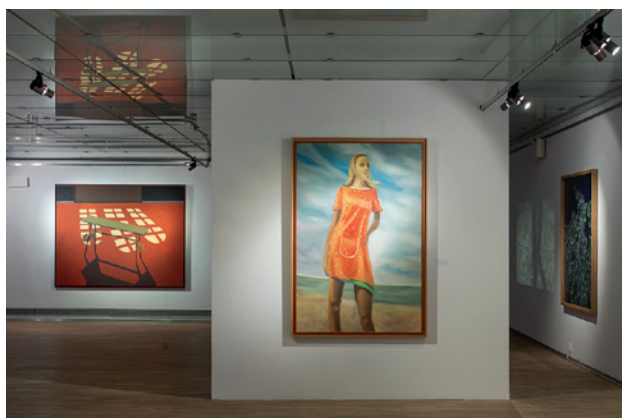
Galeria Sztuki Współczesnej w Opolu widok wystawy

Podczas wystawy zorganizowano 35 warsztatów i oprowadzań dla szkół. Wystawę odwiedziło łącznie 2645 osób.