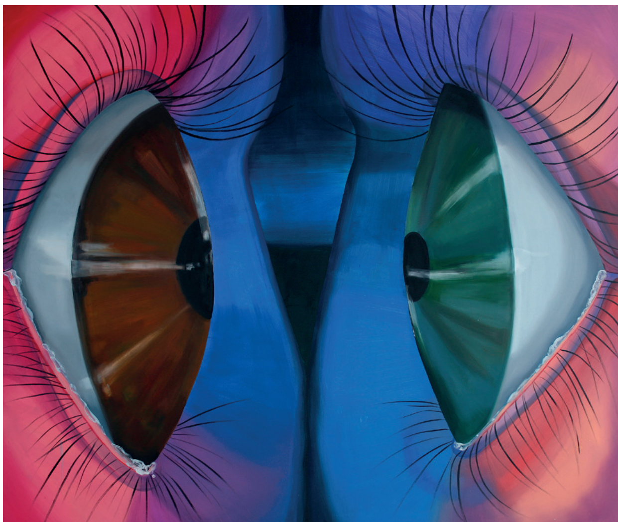
FSP ING 0168 Oczy , 2017, olej, płótno, 160 × 190 cm

Jak mówi artystka, najwygodniej pracuje jej się cyklami. Z każdym kolejnym płótnem, które dotyczy tego samego motywu – w tym wypadku: oczu, spojrzeń, i faktu bycia obserwowanym – autorka sięga do różnych zabiegów formalnych. Manipuluje skalą obiektów, kompozycją, a także perspektywą, z której patrzy obserwator. W Oczach odbiorca zostaje złapany przez obraz – w tym układzie jest trzecią parą oczu. Kompozycja sugeruje, że jest obserwatorem, o którym spoglądające na siebie postaci nie mają pojęcia. To klaustrofobiczne przedstawienie, w którym artystka starała się uchwycić siłę kontaktu wzrokowego i przełamać konfrontacyjny charakter obrazu senną atmosferą. Paleta – jak zdradza twórczyni – została skomponowana pod wpływem plastyki filmów Davida Lyncha.