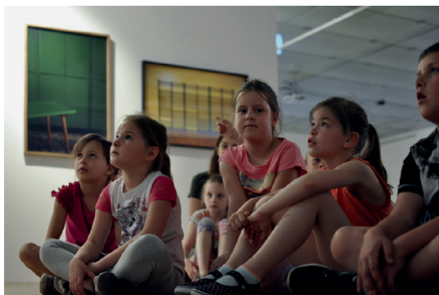
Galeria Sztuki Współczesnej w Opolu oprowadzanie dla dzieci