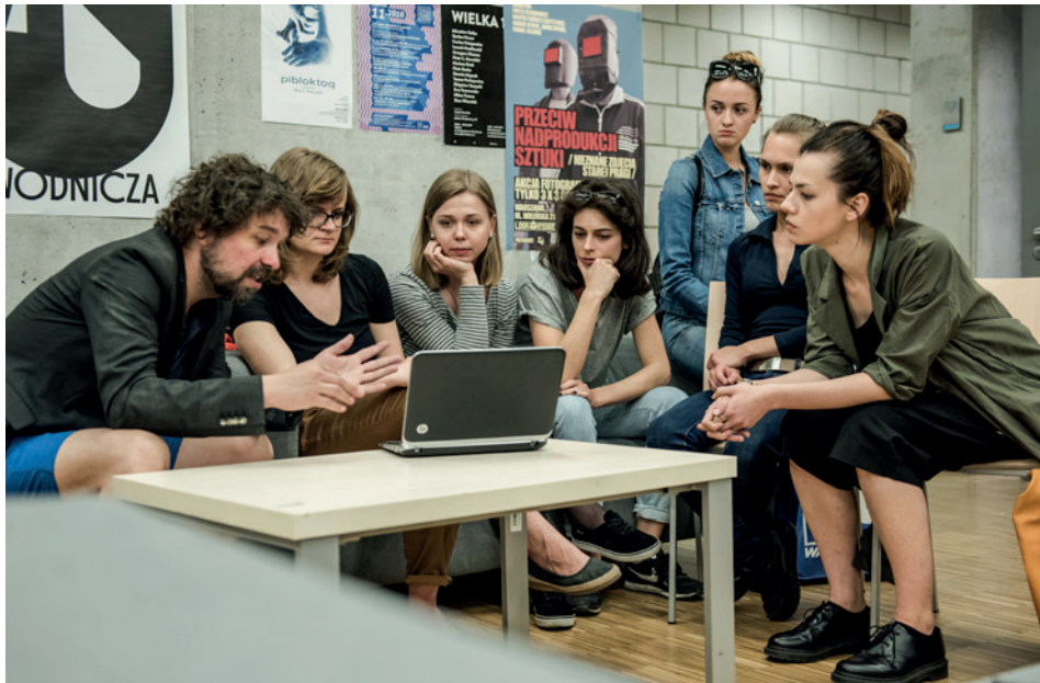
Projekt Artysta – Zawodowiec konsultacje portfolio

Uczestnicy wzięli też udział w badaniu socjologicznym mającym na celu stworzenie profilu przyszłego absolwenta ASP oraz skuteczności programu. Z badania płynnie niepodważalny wniosek, że studenci na progu życia zawodowego potrzebują wsparcia, i to w wielu obszarach. Tym samym projekt Artysta - Zawodowiec trafił bardzo precyzyjnie w ich potrzeby. Potwierdzają to oceny uczestników – 96% oceniło szkolenie pozytywnie, aż 73% respondentów uznało, że wykłady przekazywały wiedzę niezbędną dla każdego studenta kończącego studia na uczelni.