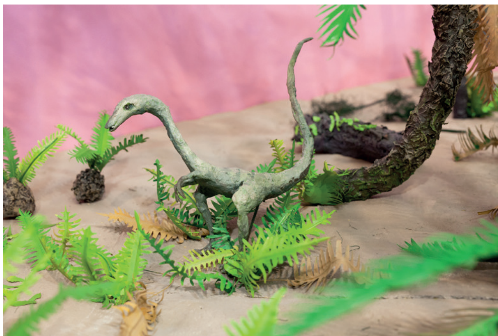
FSP ING 0169 Wczesna polskość (fragment), 2017, tworzywo sztuczne, papier, 130 × 159 × 318 cm

Katarzyna Przeważska urodziła się w 1984 roku w Warszawie, gdzie mieszka i pracuje. Jest absolwentką Wydziału Malarstwa warszawskiej ASP. W swojej pracy artystka nawiązuje do modernizmu, w sposób w jaki nigdy wcześniej nie był on postrzegany w polskiej sztuce. W przeciwieństwie do polskich artystów debiutujących po 2000 roku, modernizm według Przeważskiej nie jest jedynie estetycznym fetyszem, malowniczymi ruinami upadłej utopii czy sentymentalną podróżą do szarych, betonowych krain dzieciństwa. Konstruując wielokolorowe, silnie zindywidualizowane przestrzenie i obiekty, artystka przekonuje, że to, co było naprawdę rewolucyjne dla modernizmu, można szybko zastąpić. Nowoczesność jest naszym antykiem, bo wypaczamy jej pierwotny charakter: kolorowe elewacje, wielobarwne ściany i sufity w prywatnych domach, tęczkowe ozdoby na budynkach użyteczności publicznej i w ich otoczeniu, meble dostosowane do potrzeb właściciela... Czy dla tych, którzy zostali wychowani w środowisku surowej, betonowej, modernistycznej Polski Ludowej, nie brzmi to jak utopia? Prace Przeważskiej pozwalają nam z dystansem spojrzeć na lukę, w której znalazła się polska przestrzeń publiczna.