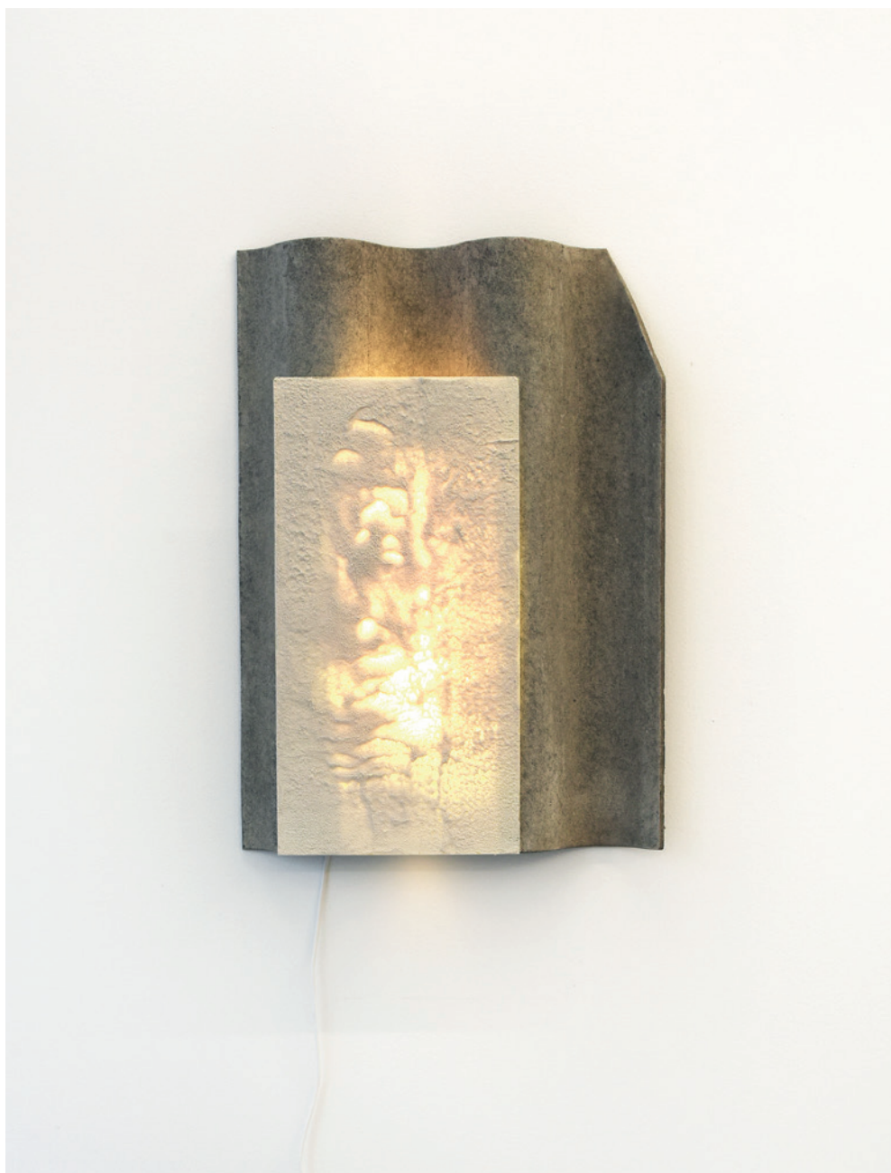
FSP ING 0166 Ways Back , 2017 włókno-cement, szkło, lampa jarzeniowa, 58 × 41 × 7 cm

Praca Ways Back z 2017 roku wchodzi w skład cyklu Masa i stan , na który składają się obiekty rzeźbiarskie odnoszące się do stanów wewnętrznych człowieka. Za pomocą kształtów i faktury materii, artystka stara się dotrzeć do najgłębszych emocji – stanów napięć i delikatności, które w tej pracy zyskują reprezentację wizualną. Praca ta, podobnie jak inne obiekty Mickiewicz, odnosi się do przedmiotów codziennego użytku.