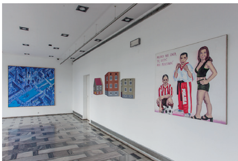
Galeria Sztuki Współczesnej w Opolu widok wystawy