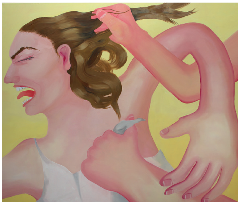
FSP ING 0167 Bijące się dziewczyny , 2016, olej, płótno, 130 × 130 cm