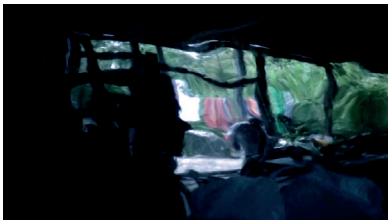
Ewa Zarzycka Kosmos prywatny , 2011, wideo, 6'27"