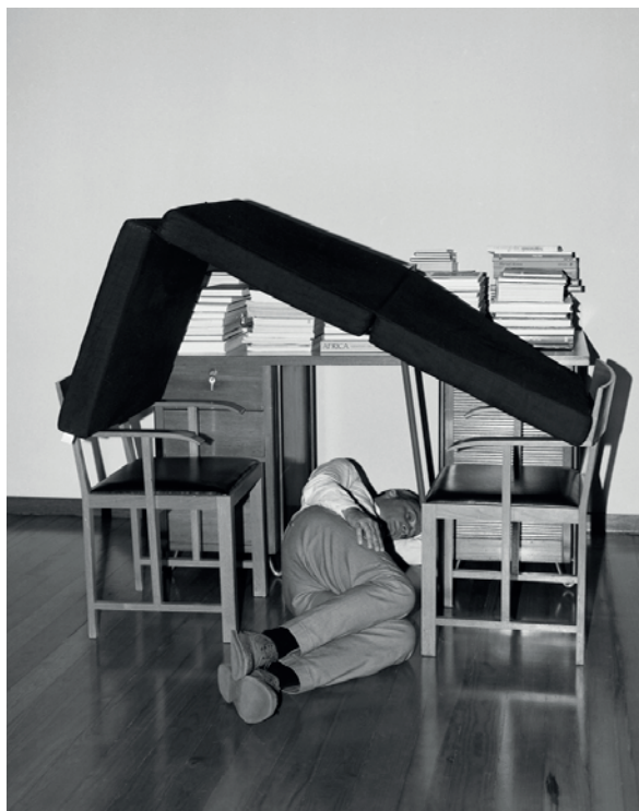
FSP ING 0172 bez tytułu , 2016, odbitka żelatynowo-srebrowa, 120 x 95 cm ed. 3/3+1 AP

Cykl Shelters został zrealizowany w Lizbonie, Rio de Janeiro i Warszawie. Bohaterowie fotografii z pomocą artystki budowali w swoich mieszkaniach rodzaj schronienia czy fortu z mebli, tkanin i przedmiotów osobistych, na wzór konstrukcji zapamiętanych z dziecięcej zabawy. Powstała seria prac to zarówno rodzaj inwentarza efemerycznych konstrukcji, jak i zbiór portretów psychologicznych ich mieszkańców – niektóre budowle są solidne i minimalistyczne, inne kruche i chaotyczne. Przedmioty użyte do ich zbudowania, oraz uchwycone na zdjęciach otoczenie, dają pewne wyobrażenie co do zainteresowań, trybu życia i statusu społecznego bohaterów. Tytuł Shelters (Schronienia) wskazuje na różne możliwe drogi interpretacji – czy mamy do czynienia z dziecięcą zabawą, czy próbą odzyskania poczucia bezpieczeństwa w niepewnych czasach? Czy schronienia to bezpieczne oazy, czy izolujące od świata pułapki?