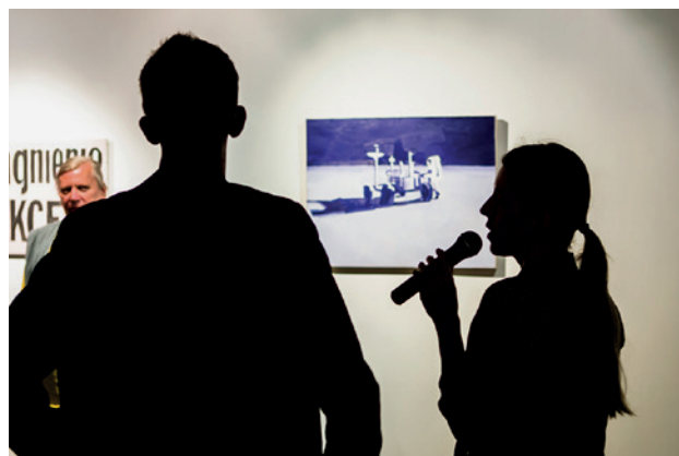
Galeria Sztuki Współczesnej w Opolu otwarcie wystawy