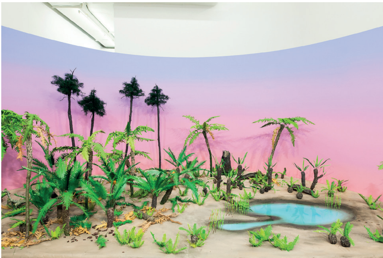
FSP ING 0169 Wczesna polskość, 2017, tworzywo sztuczne, papier, 130 × 159 × 318 cm

Nie dalej jak kilkaset milionów lat temu Warszawę porastały rośliny przypominające palmy. Były dużo lepsze niż ta, która stoi na rondzie de Gaulle'a, bo żywe. Nasza stolica znajdowała się znacznie bliżej równika, i jeśli akurat nie zakrywało jej morze, to rósł na niej subtropikalny las. Las zamieszkiwany przez zwierzęta – nawet dinozaury. Krótko mówiąc, stolica Polski miała się lepiej, gdy nie było jeszcze Polski.