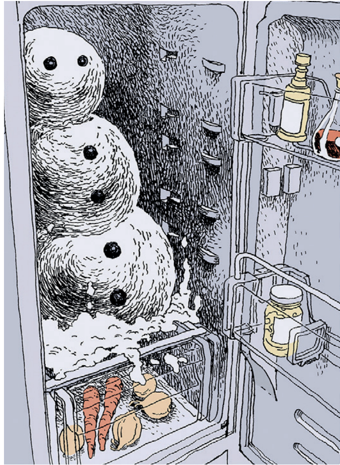
Bałwan w lodówce ilustracje: Krzysztof Gawronkiewicz